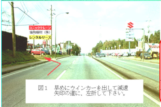
図1 早めにウインカーを出して減速 矢印の道に、左折して下さい。