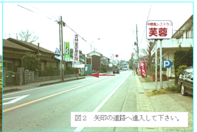
図2 矢印の道路へ進入して下さい。